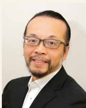
基調講演 高松 平藏 氏 ドイツ在住ジャーナリスト